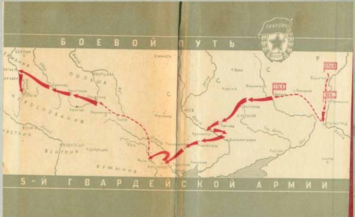
Фото 5. Боевой путь 5-й Гвардейской армии.